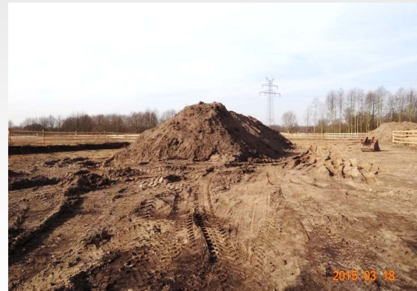
Standpunkt: Einfahrt „Am Hafen“