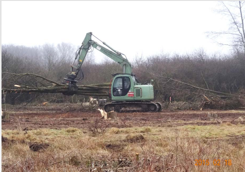
Transport von Stammholz entlang der Strecke