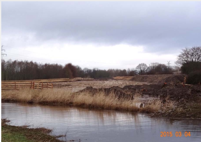
Blickrichtung: Deich südlich der Pinnau Richtung Norden