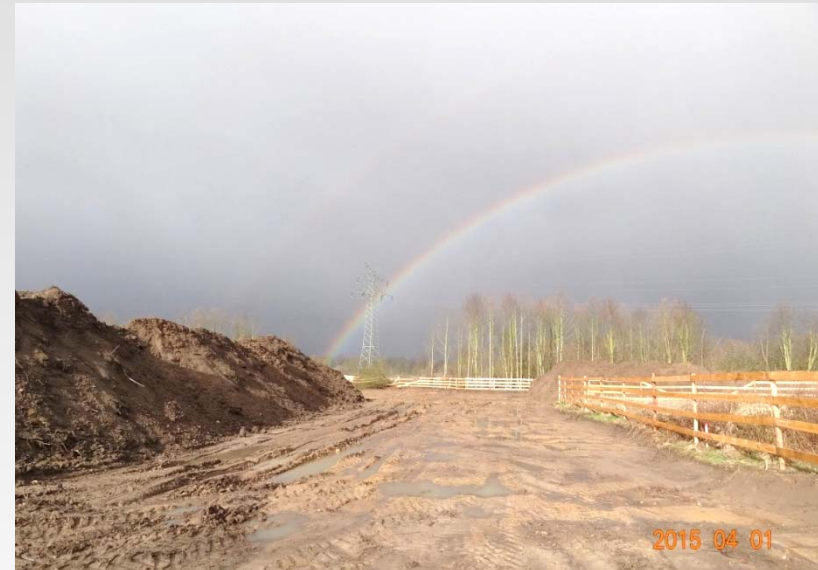
Blick von der geplanten Einfahrt „Am Hafen“ Richtung Westen (freigeschobene Trasse mit Miete)