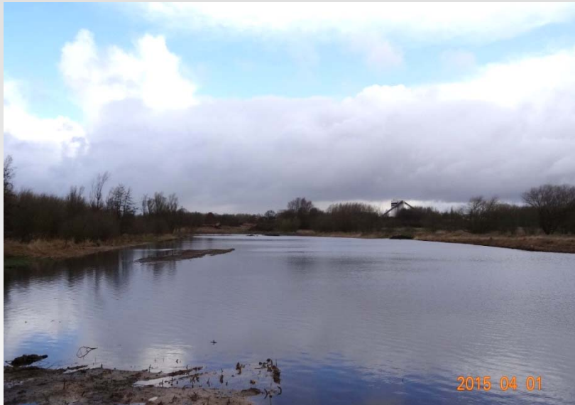
Blick vom Mühlenstraße nach Norden Richtung Pinnau (kein Zugang zum Gelände wg. Hochwasser)